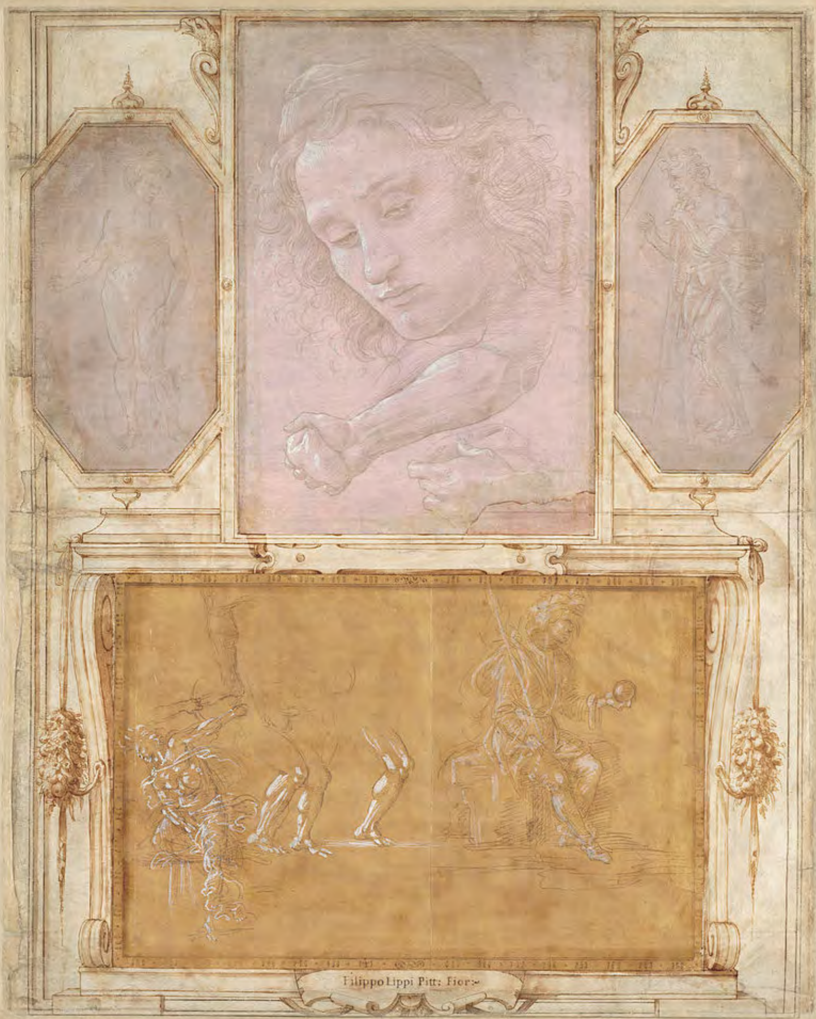
Giorgio Vasari, Libro de' Disegni, Filippino Lippi, Botticelli, and Raffaellino del Garbo, 16. Jhd.