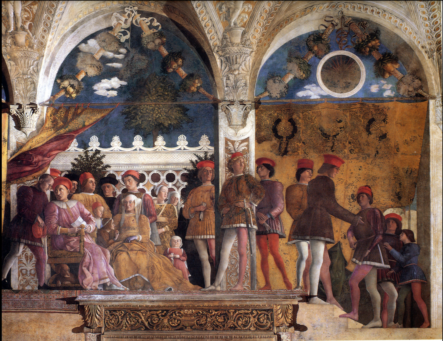
Andrea Mantegna, La chambre des Époux : la cour , 1465-1474, fresque, Mantoue, palazzo ducale