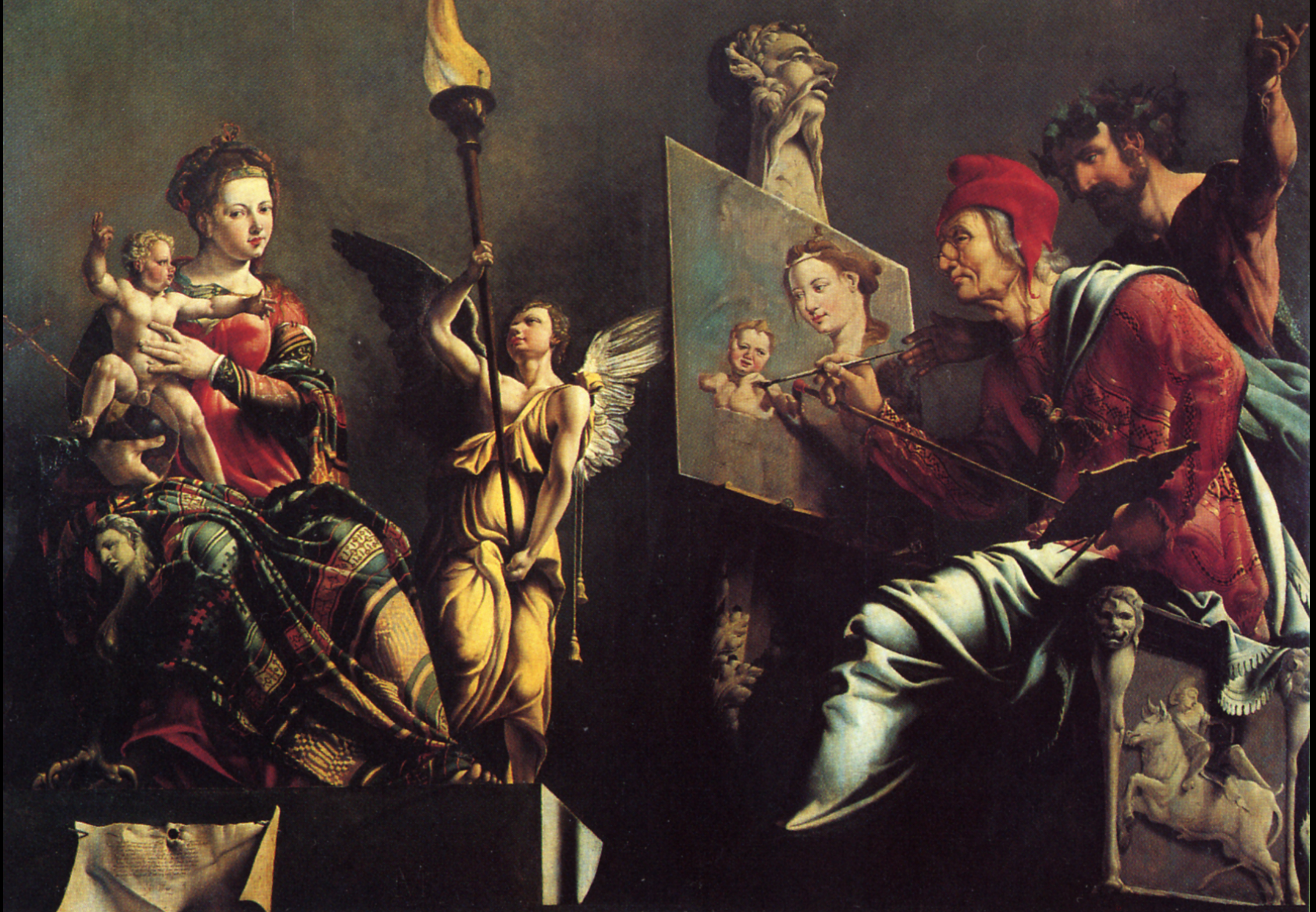
Maerten van Heemskerck, Saint Luc peignant la Vierge , 1532, huile sur bois, 168 x 235 cm, Haarlem, Frans Halsmuseum