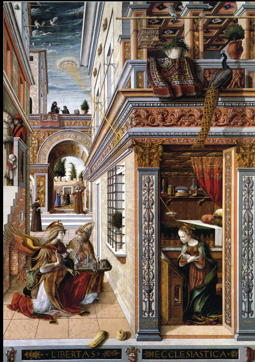
Carlo Crivelli, L'Annonciation , 1486, détrempe et huile sur bois, 207 x 146,7 cm, Londres, National Gallery

Effet repoussoir Troncage narratif Parcourabilité Saillie