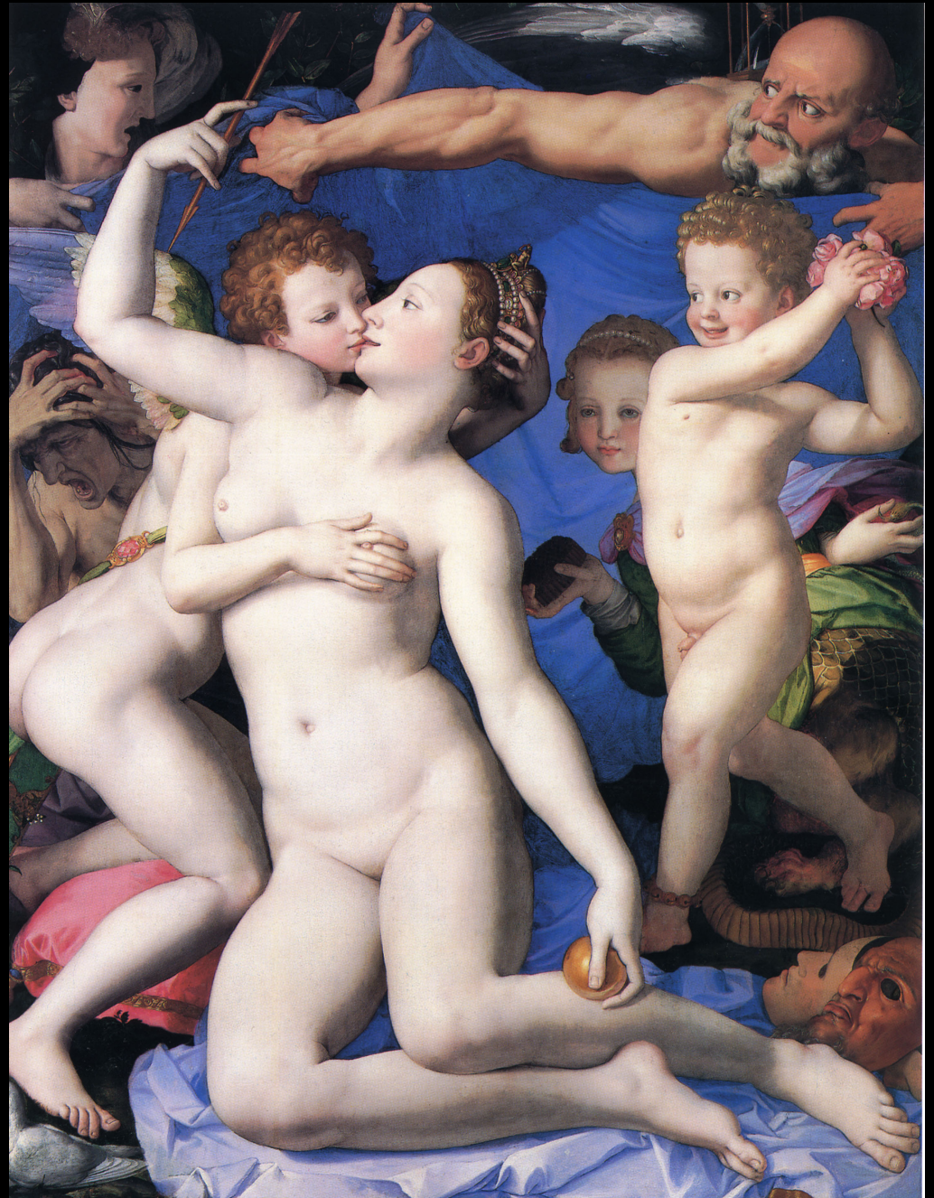
Bronzino, Vénus et cupidon , 1544-1545, huile sur bois, 146 x 116 cm, Londres, National Gallery