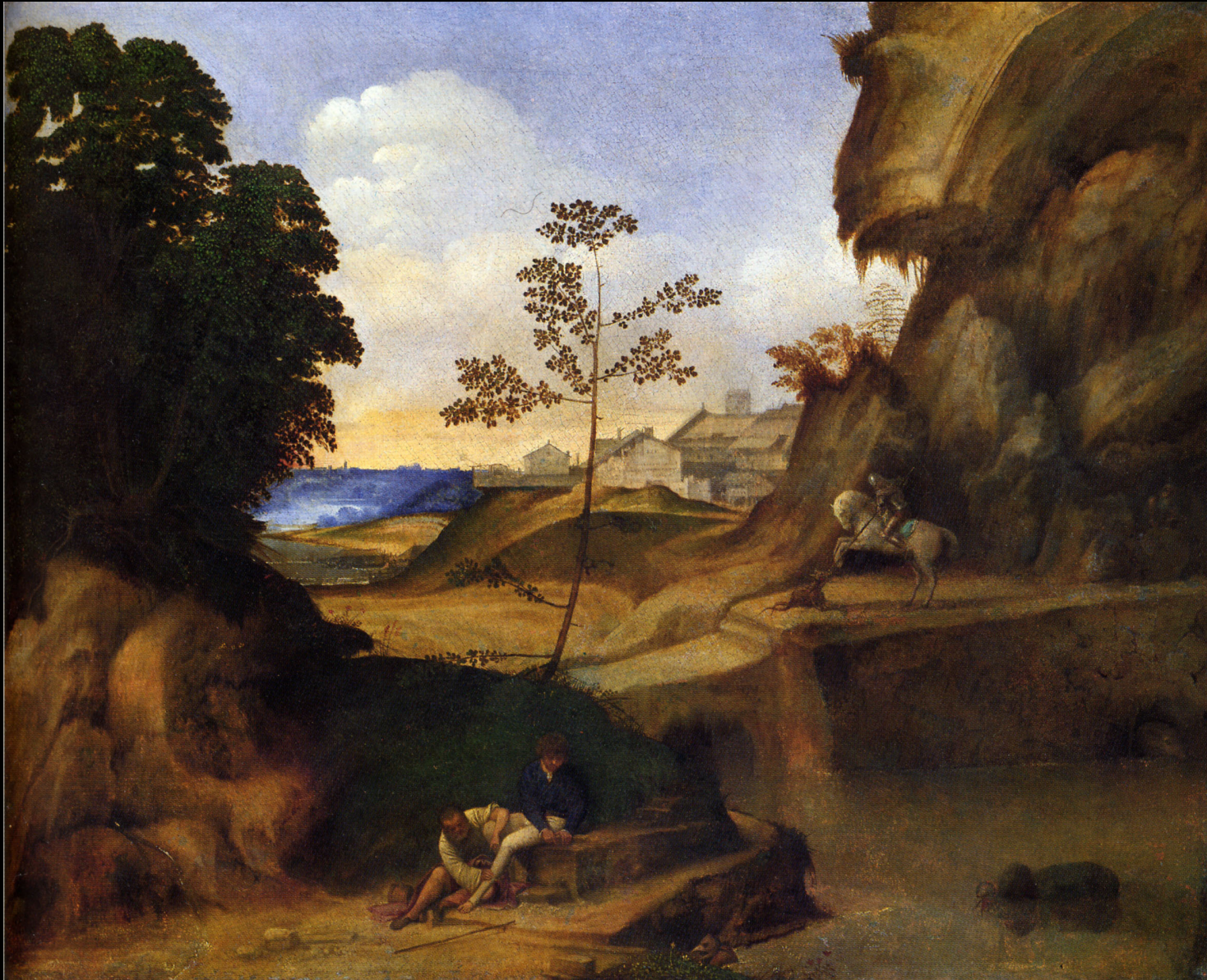
Giorgione, Tramonto , vers 1506-1510, huile sur toile, 73 x 91 cm, Londres, National Gallery