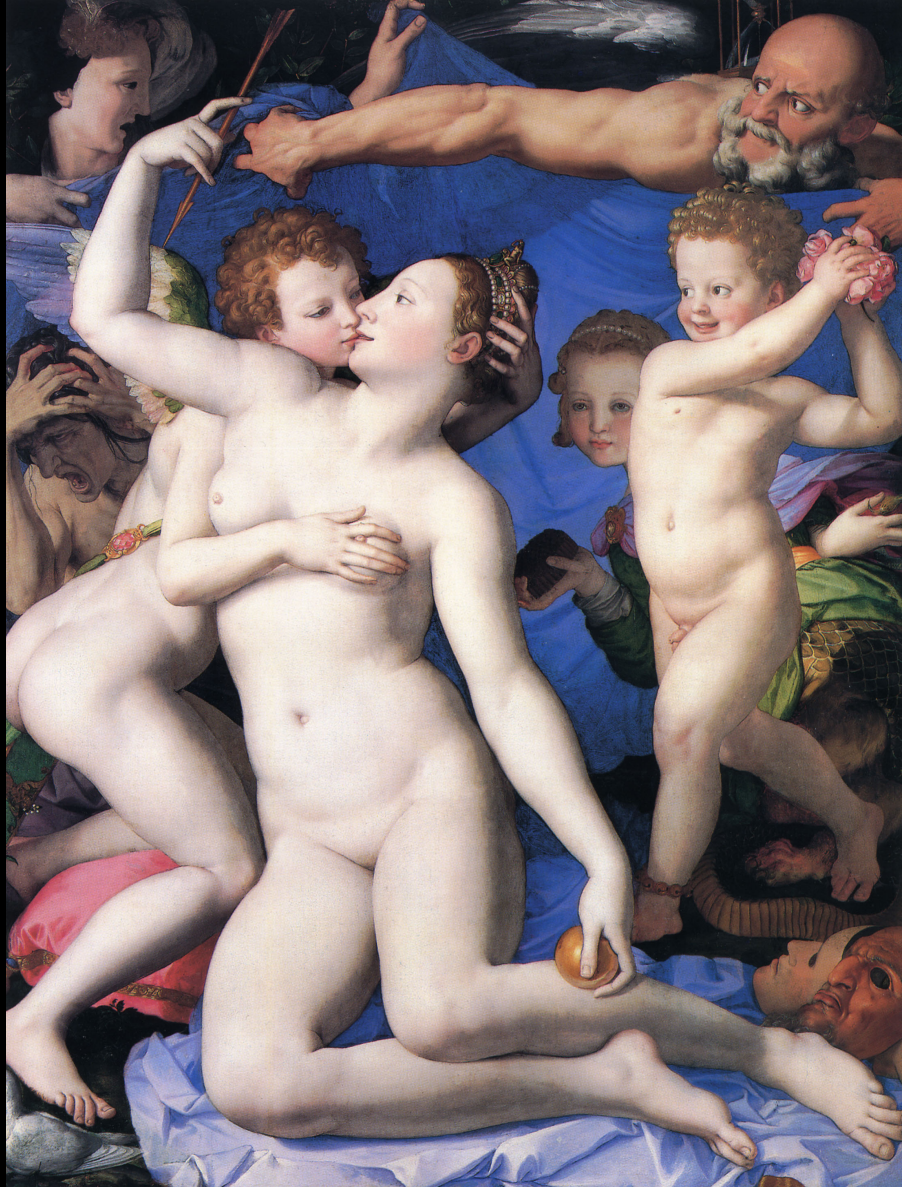
Bronzino, Vénus et cupidon , 1544-1545, huile sur bois, 146 x 116 cm, Londres, National Gallery