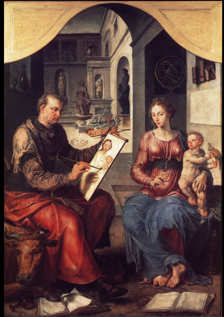
Maerten van Heemskerck, Saint Luc peignant la Vierge , 1555. Rennes, Musée des Beaux-Arts