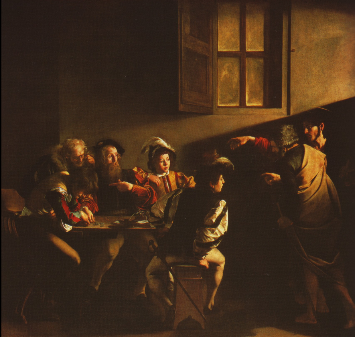
Caravage, La vocation de saint Matthieu , 1599-1600, huile sur toile, 322 x 340 cm, Rome, Église Saint-Louis-des-Français, chapelle Contarelli