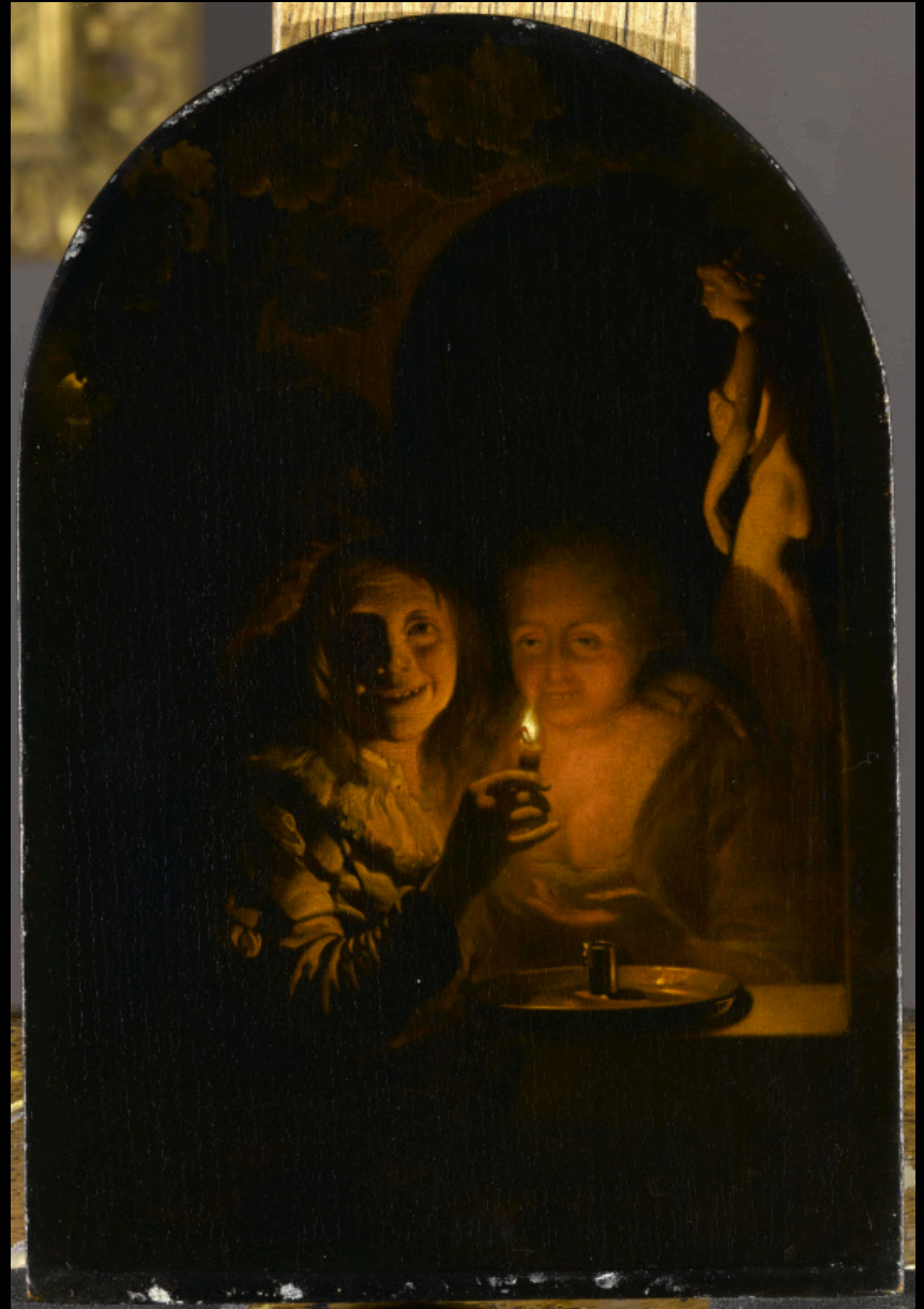
Godfried Schalcken, Couple d'amoureux éclairé par une bougie , vers 1665-1670, huile sur bois, 20 x 14 cm, Paris, Musée du Louvre