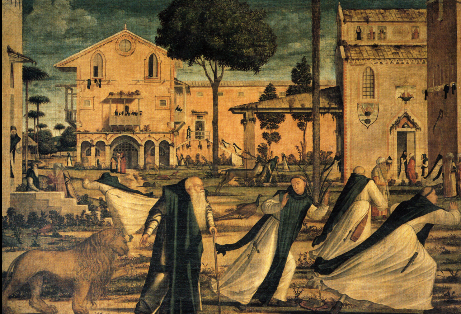
Vittore Carpaccio, Saint Jérôme ramenant le lion au monastère , 1502-1505, huile sur toile, 141 x 211 cm, Venise, Scuola di San Giorgio degli Schiavoni