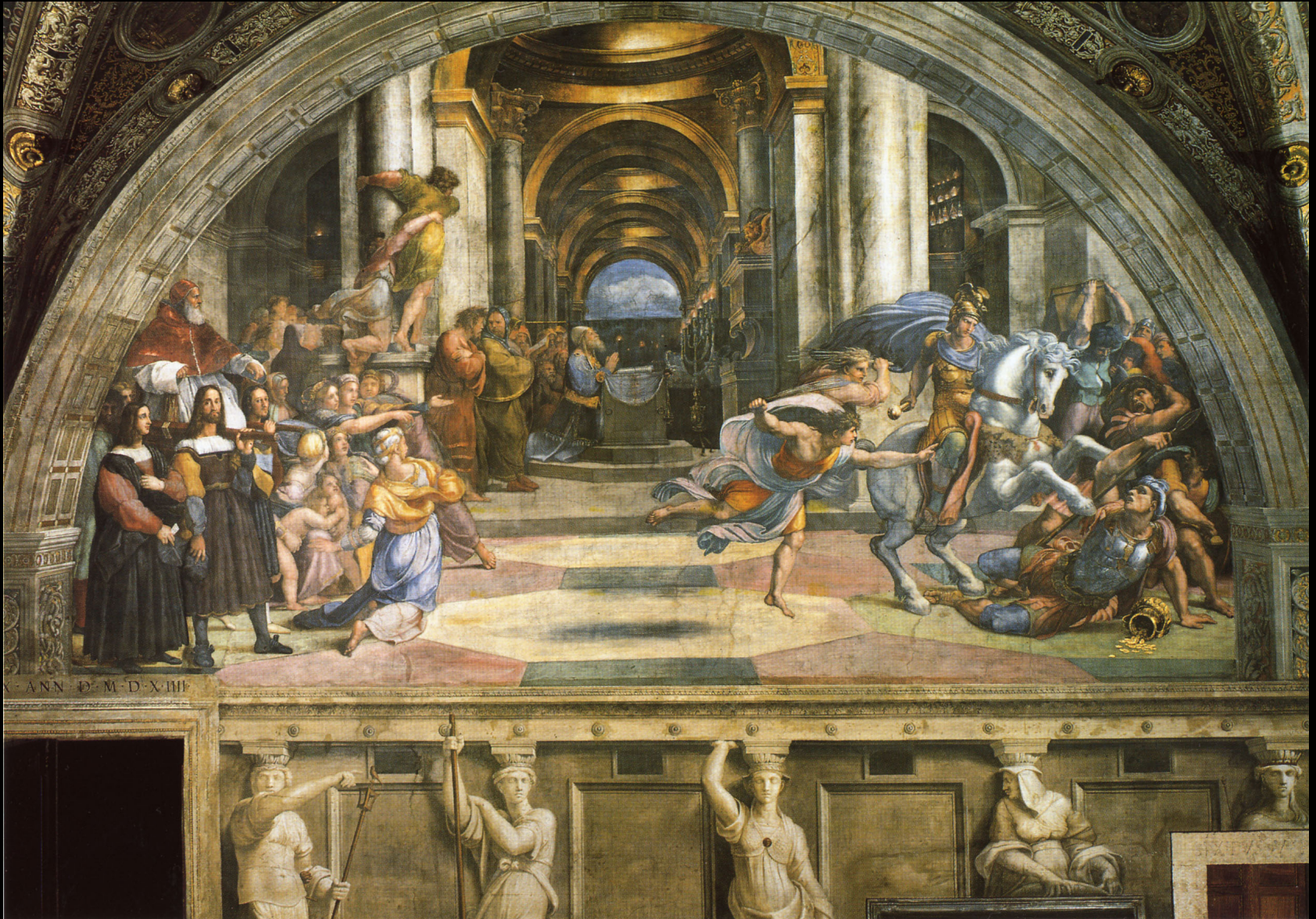
Raphaël, Héliodore chassé du temple , 1511-1512, fresque, base 7,50 m, Rome, palais du Vatican, chambre d'Héliodore