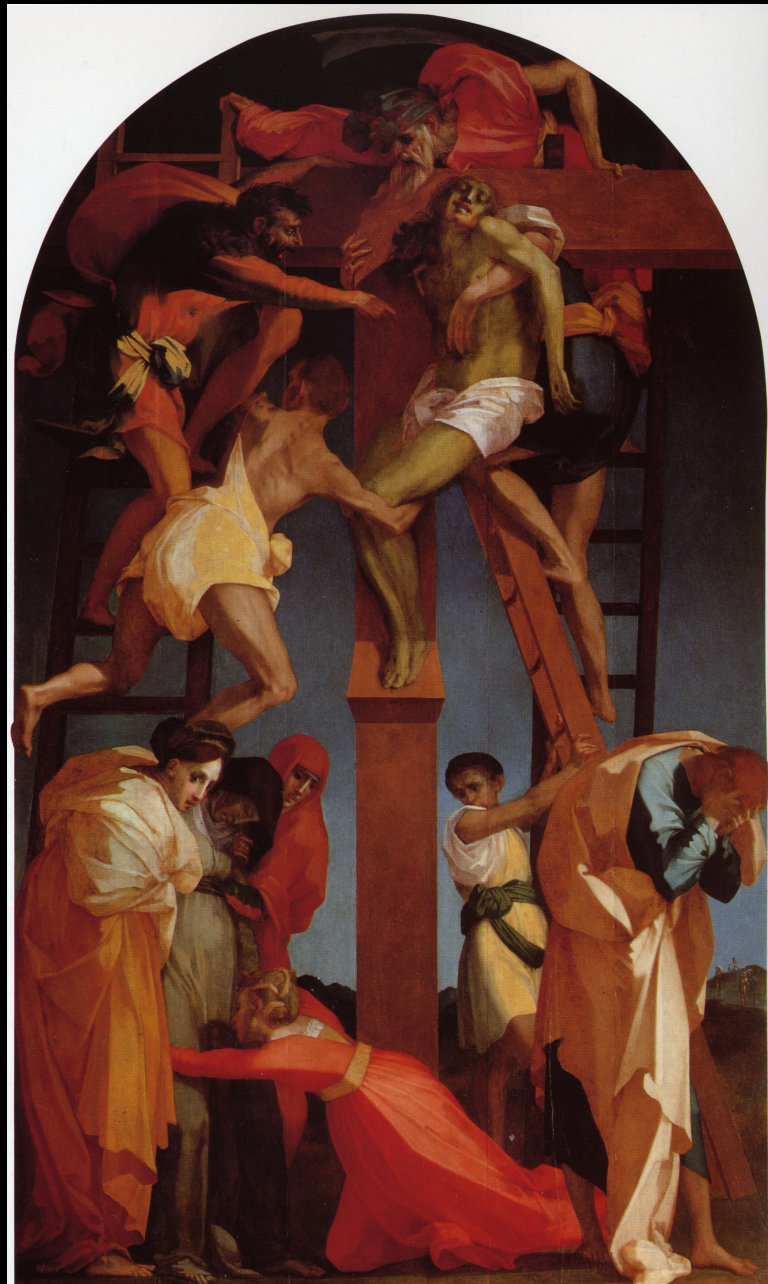
Rosso Fiorentino, Déposition de Croix , 1521, huile sur bois, 341 x 201 cm, Volterra, Pinacothèque