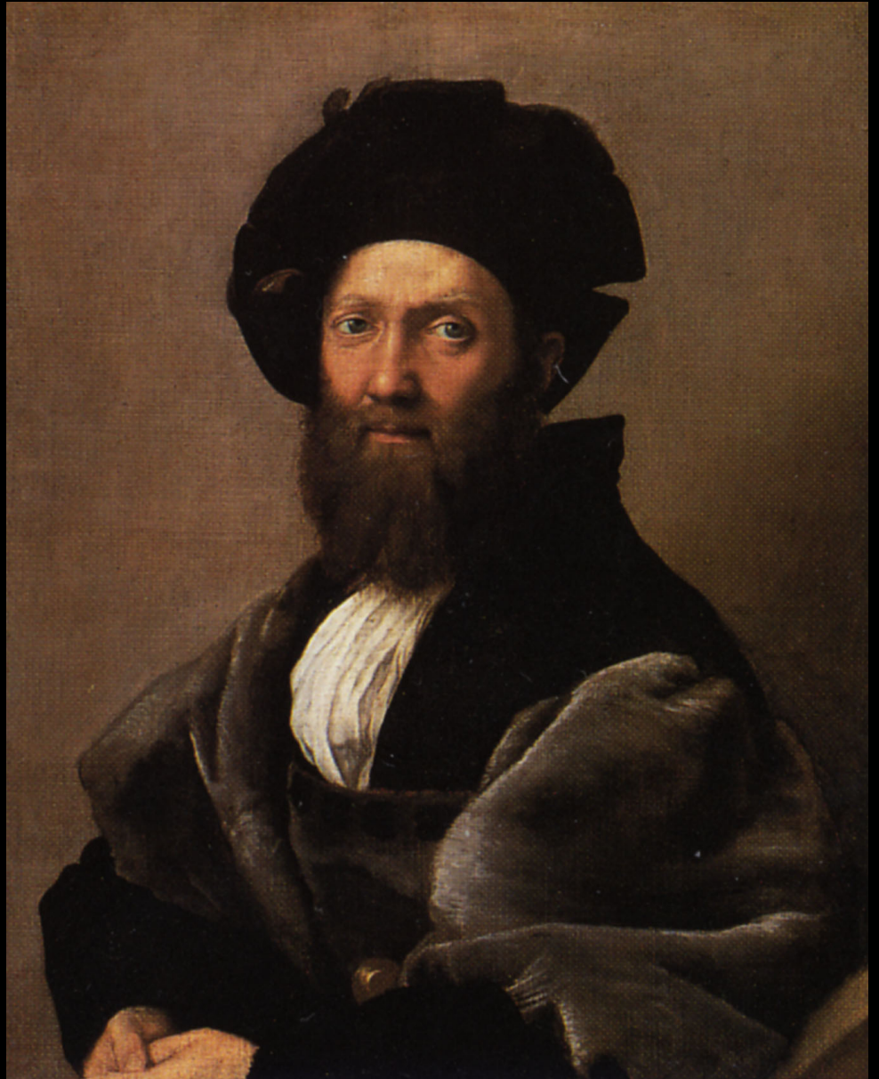
Raphaël, Baldassare Castiglione , 1516-1518, huile sur toile, 82 x 67 cm, Paris, Musée du Louvre

Effets de proximité ou d'éloignement des personnages par rapport au spectateur