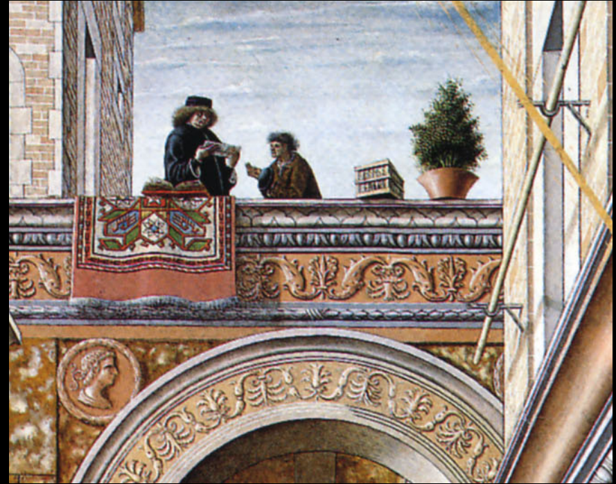
Carlo Crivelli, L'Annonciation , 1486, détrempe et huile sur bois, 207 x 146,7 cm, Londres, National Gallery