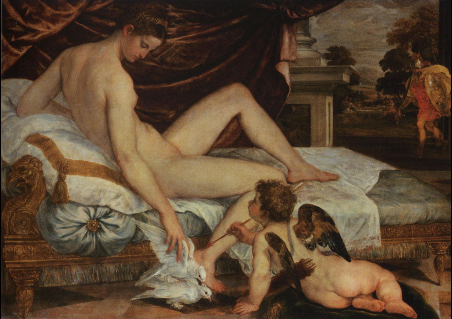
Lambert Sustris, Vénus attendant Mars , vers 1560, huile sur toile, 132 x 184 cm, Paris, Musée du Louvre