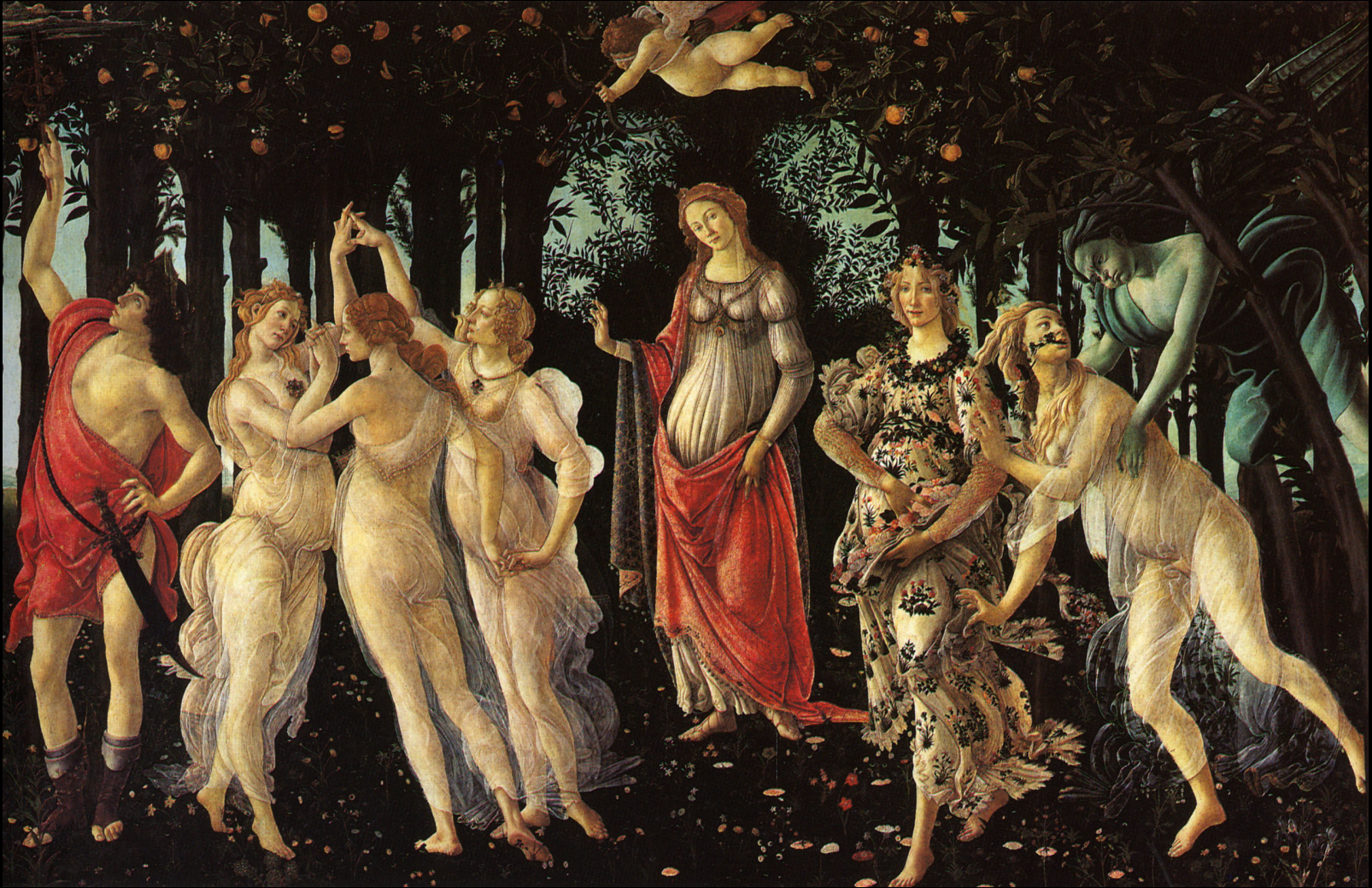
Sandro Botticelli, Le printemps , vers 1482, tempera sur peuplier, 203 x 314 cm, Florence, galerie des Offices

B. De quelle façon le peintre occupe-t-il le champ de l'image ?