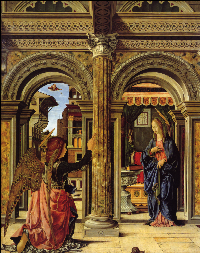
Francesco del Cossa, L'Annonciation , 1470, détrempe sur bois, 137 x 113 cm, Dresde, Gemäldegalerie