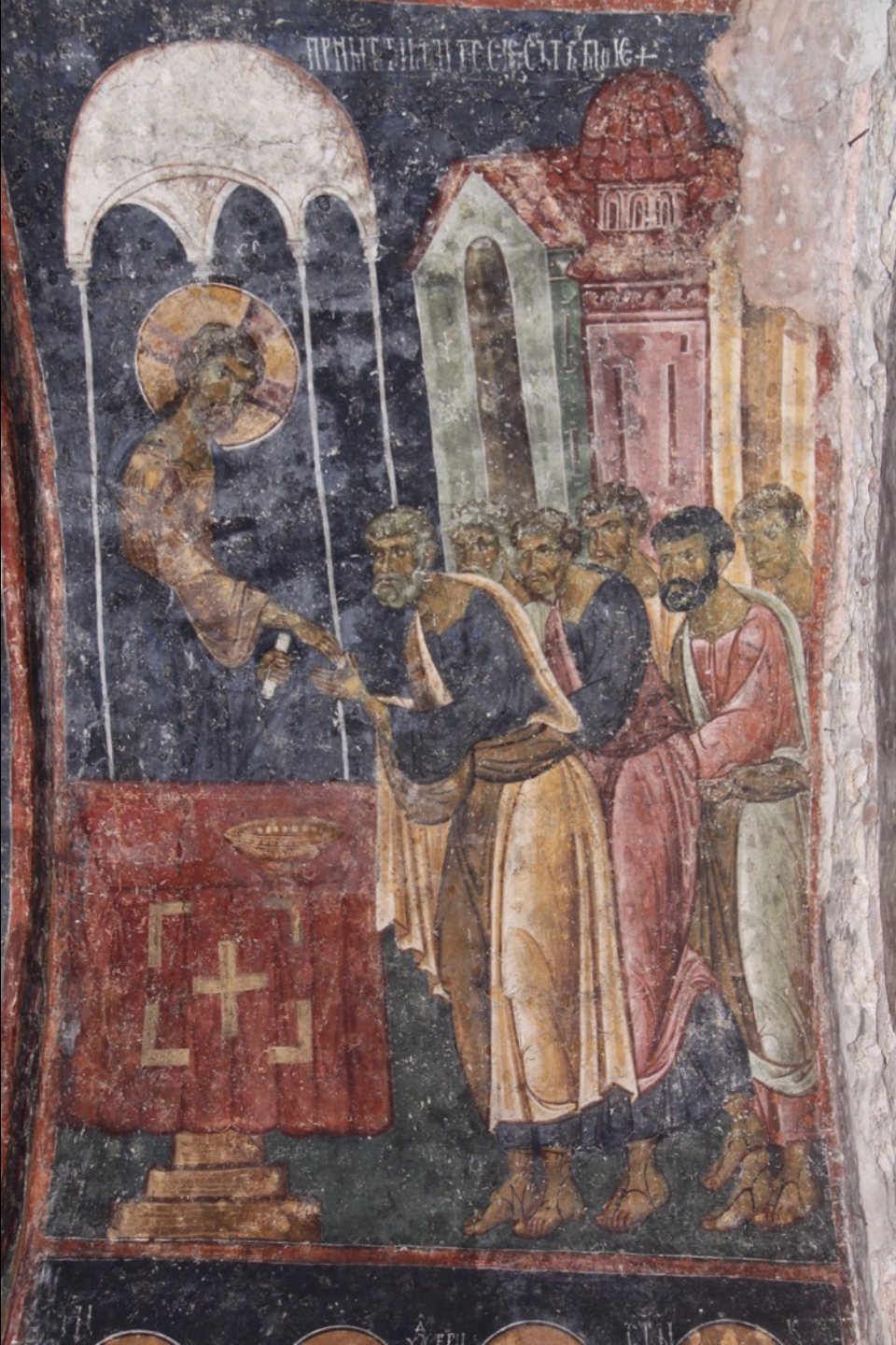
Kommunion der Apostel. Peć, Patriarchat, Apostelkirche