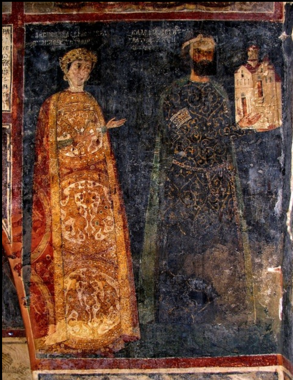
Sebastokrator Kaloyan und Prinzessin Desislava als Stifter der Bojana-Kirche, 1259. Bojana, Kirche der Hll. Nikolaus und Panteleimon.