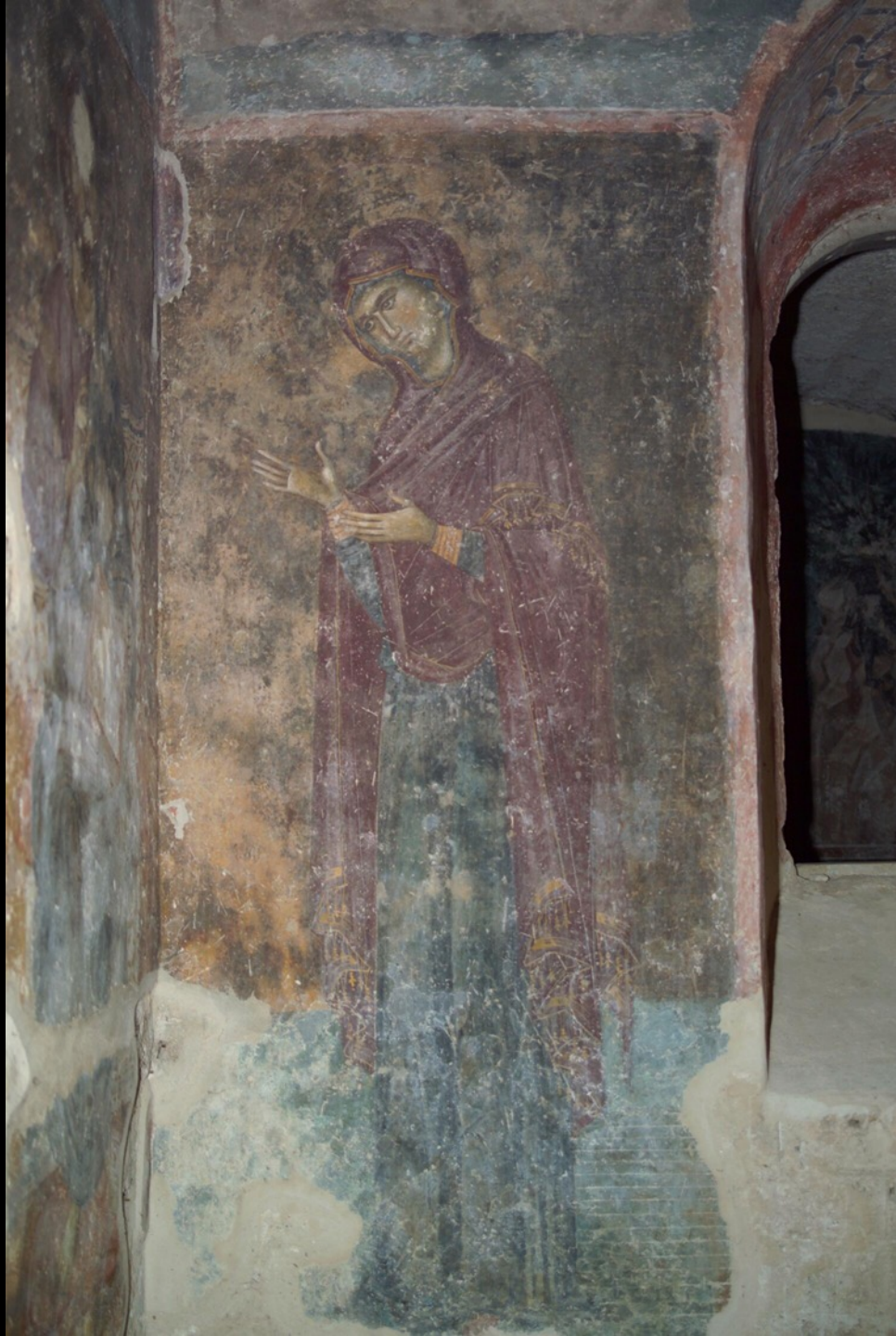
Fürbitte Mariä vor Christus zugunsten der Nemanjić