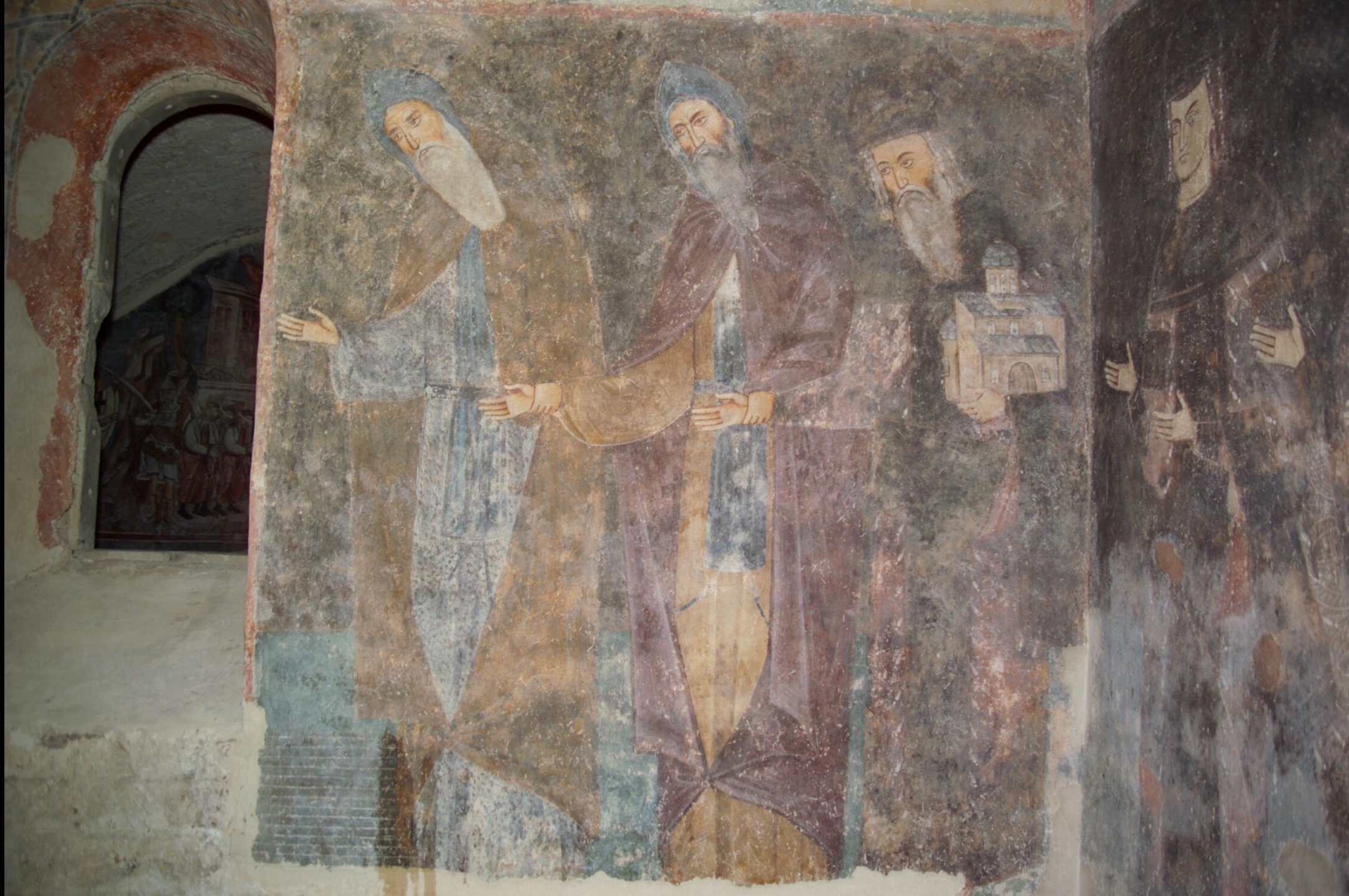
Stefan Nemanja, Stefan der Erstgekrönte, Stefan Uroš I und Dragutin, um 1275