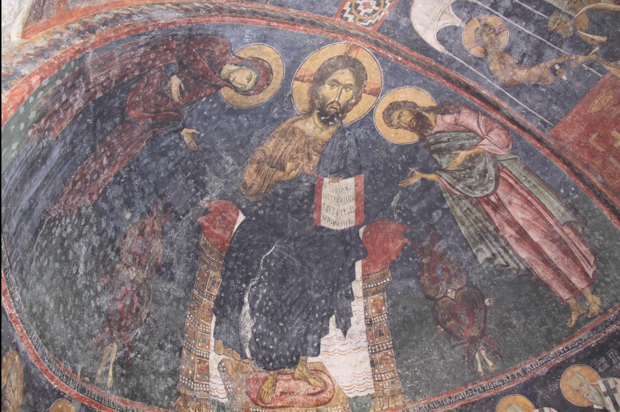
Deesis, um 1250. Peć, Patriarchat, Apostelkirche