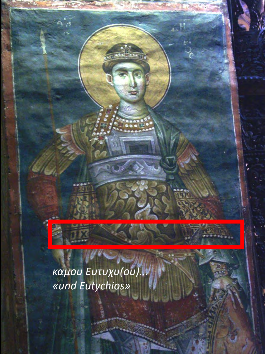
καμου Ευτυχυ(ου)... «und Eutychios»