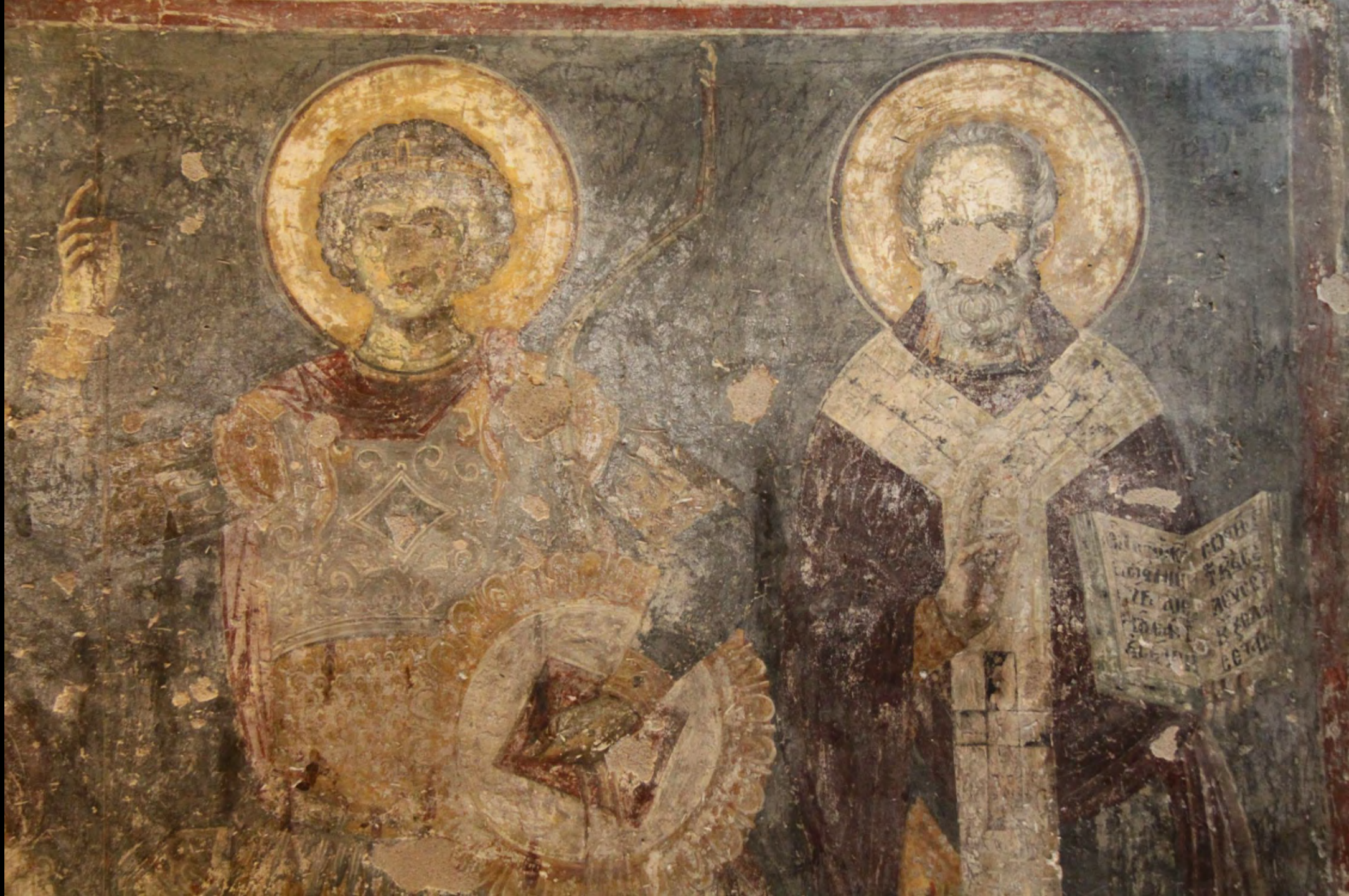
Hll. Georg und Nikolaus, um 1302-1303. Thessaloniki, Hagios Demetrios, Euthymioskapelle