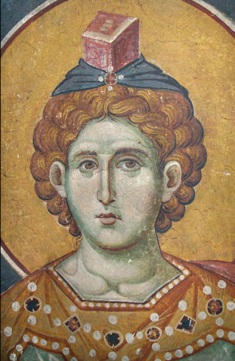
Konstantinos Vapheides, The Wall Paintings of the Protaton Church Revisited , «Zograf» 43 (2019), S. 113-128