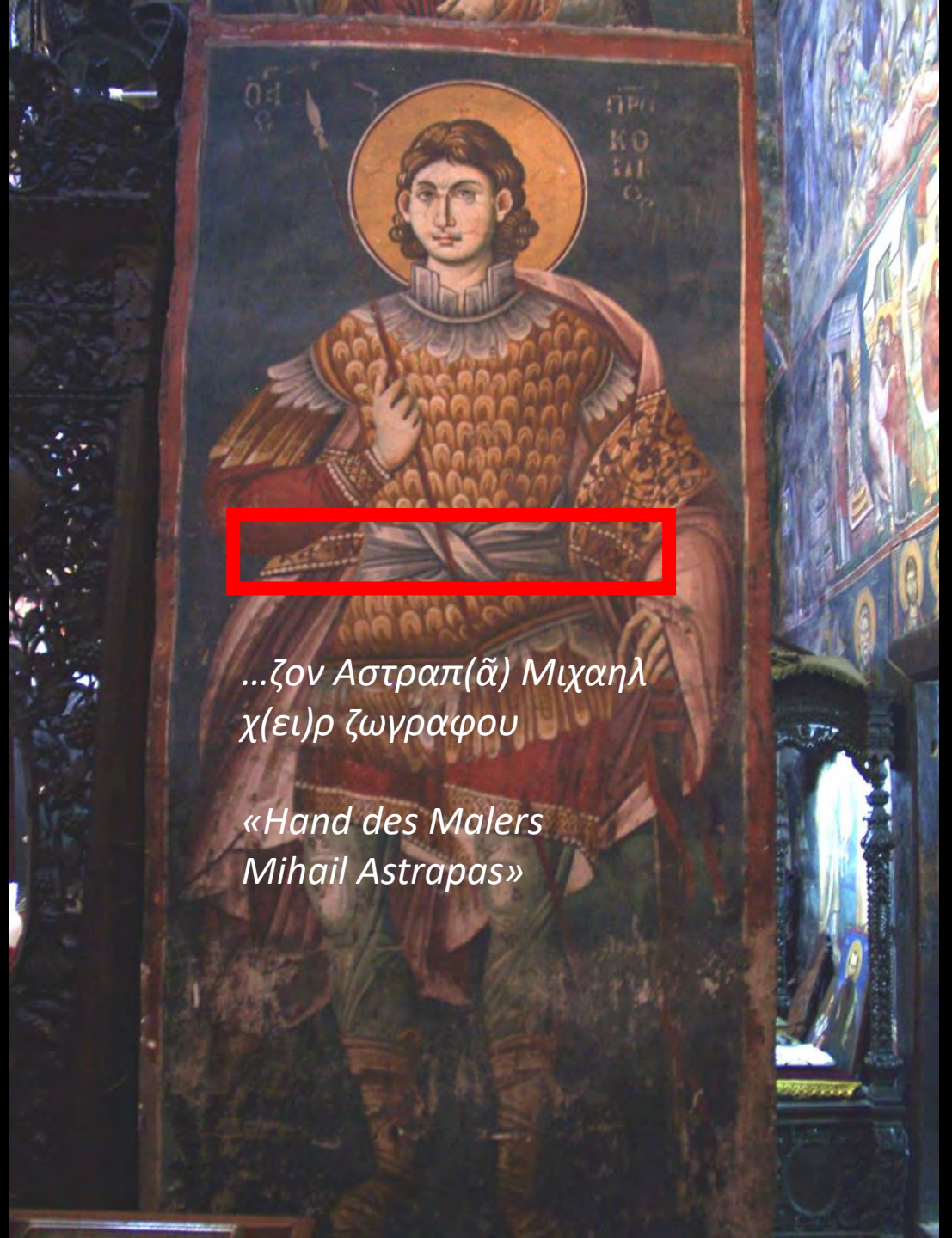
...ζον Αστραπ(ᾶ) Μιχαηλ χ(ει)ρ ζωγραφου