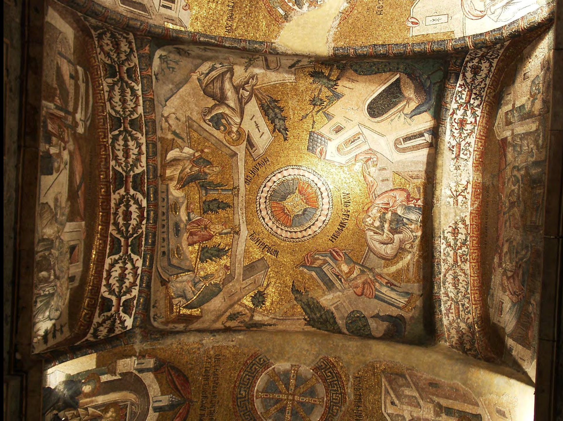
Kindheit der Gottesmutter Maria, Mosaiken, um 1316-1321. Konstantinopel, Chora-Kirche