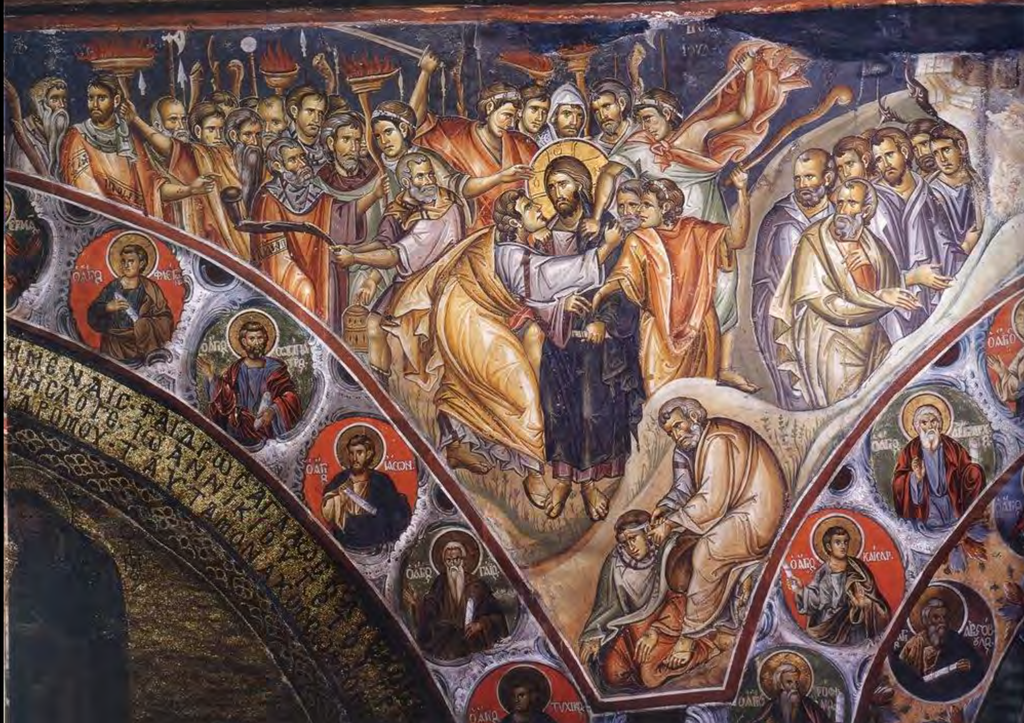
Judaskuss und Festnahme Christi im Gethsemane, 1312. Athosberg, Kloster Vatopedi, Katholikon