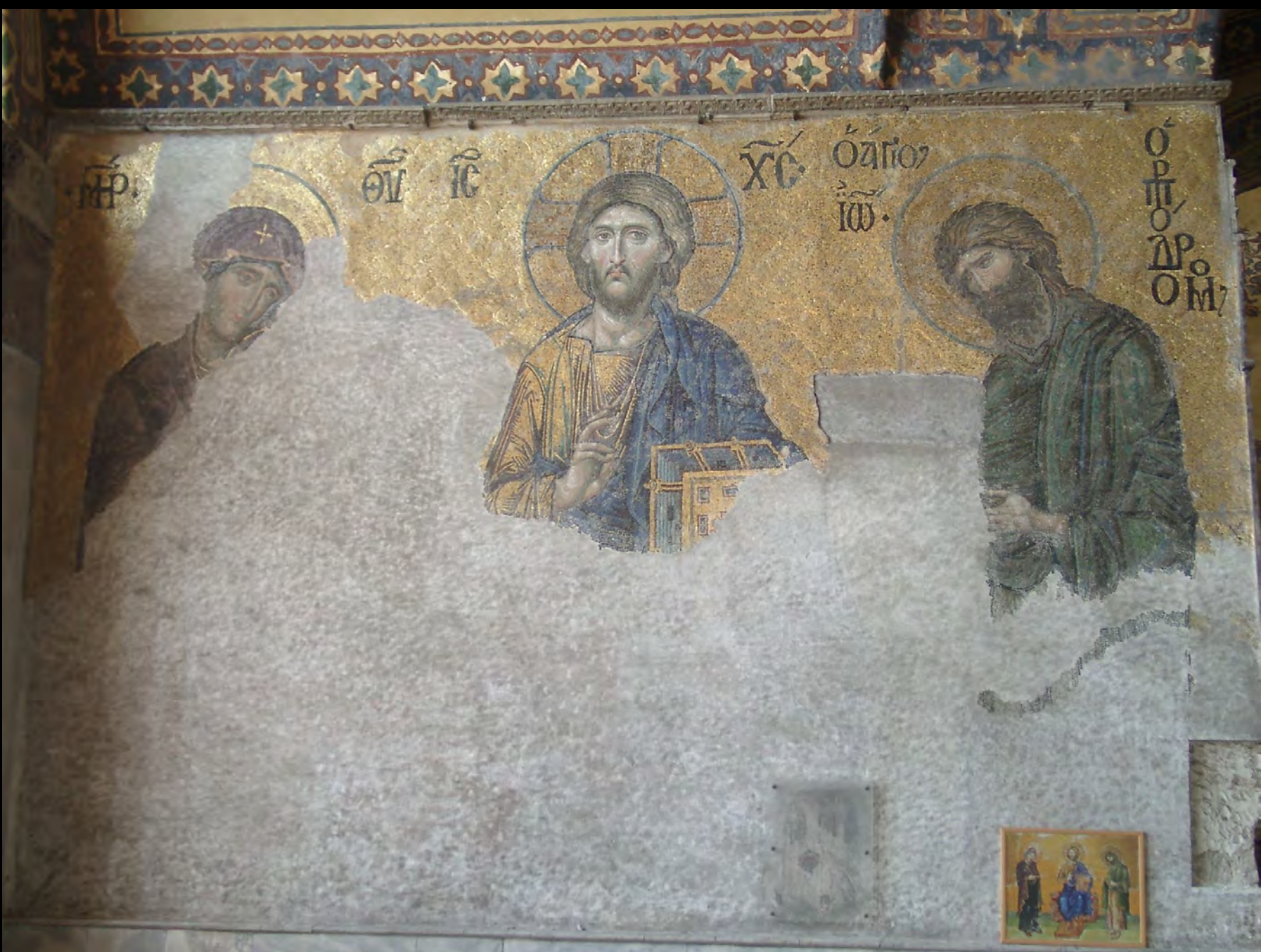
Deesis, Mosaik, um 1261. Konstantinopel, Hagia Sophia