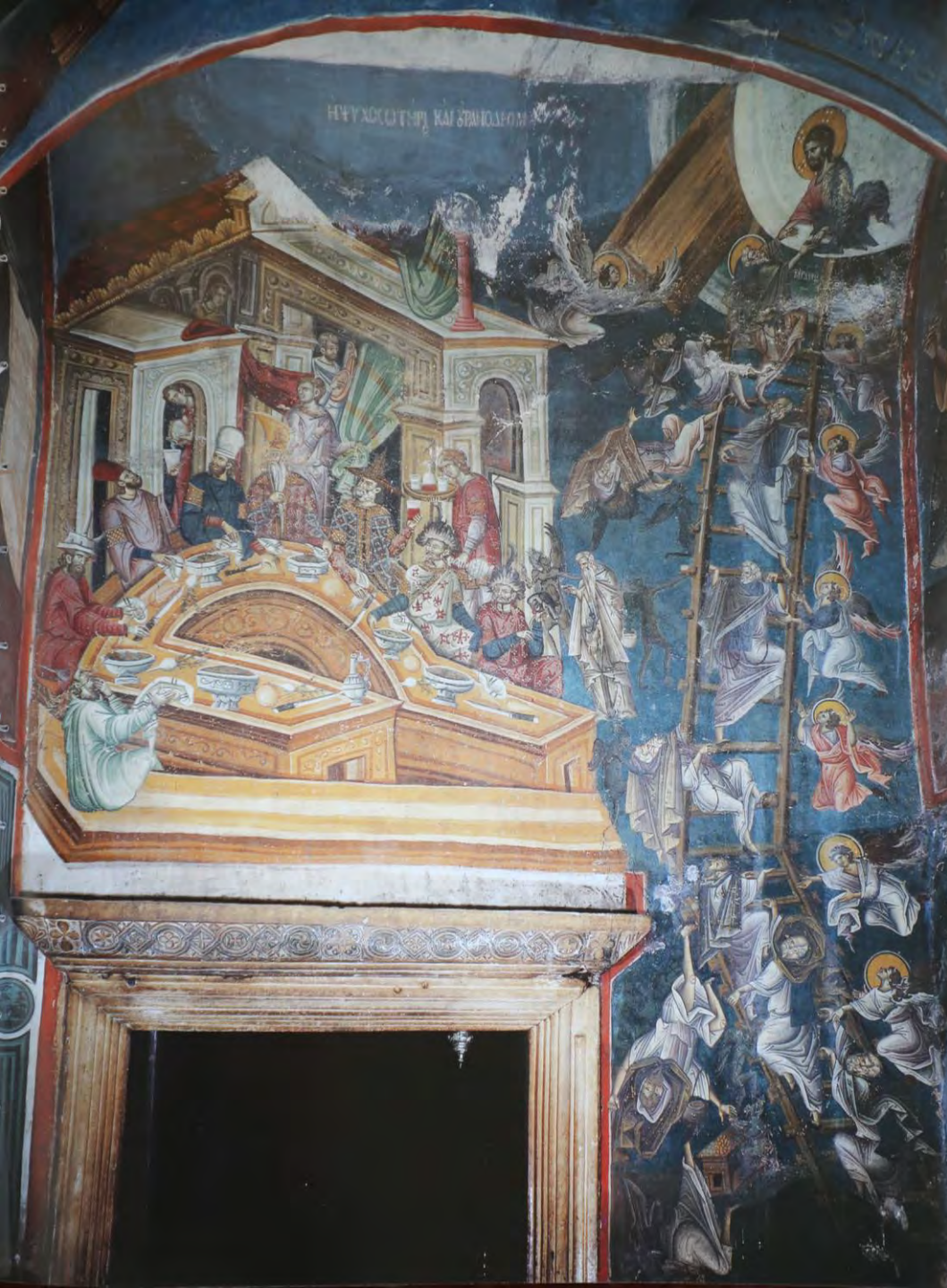
Die himmlische Treppe des Johannes Klimakos, 1312. Athosberg, Kloster Vatopedi, Katholikon, Exonarthex