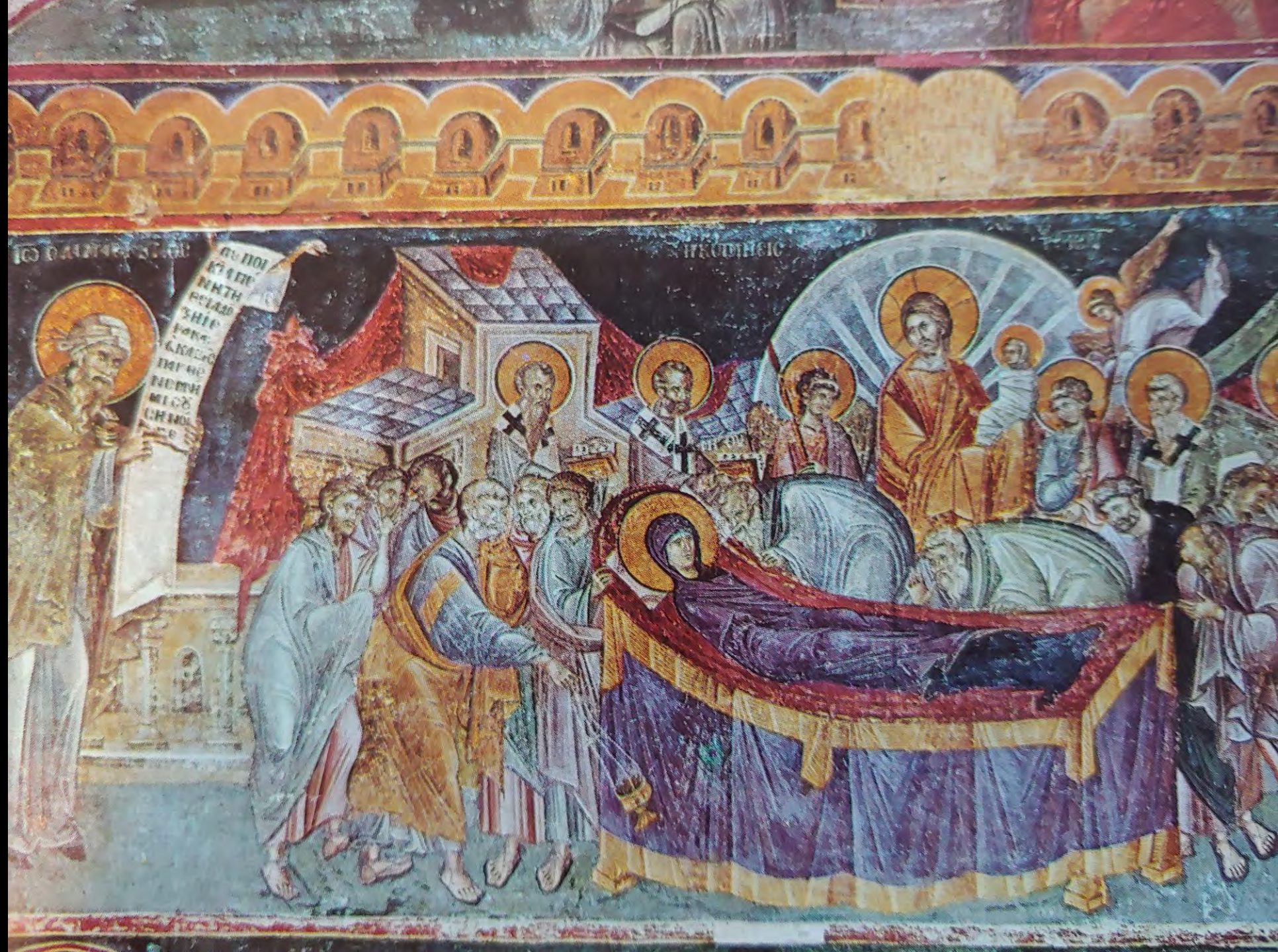
Kalliergis, Dormition , wall painting, 1315, detail. Veroia, Christos