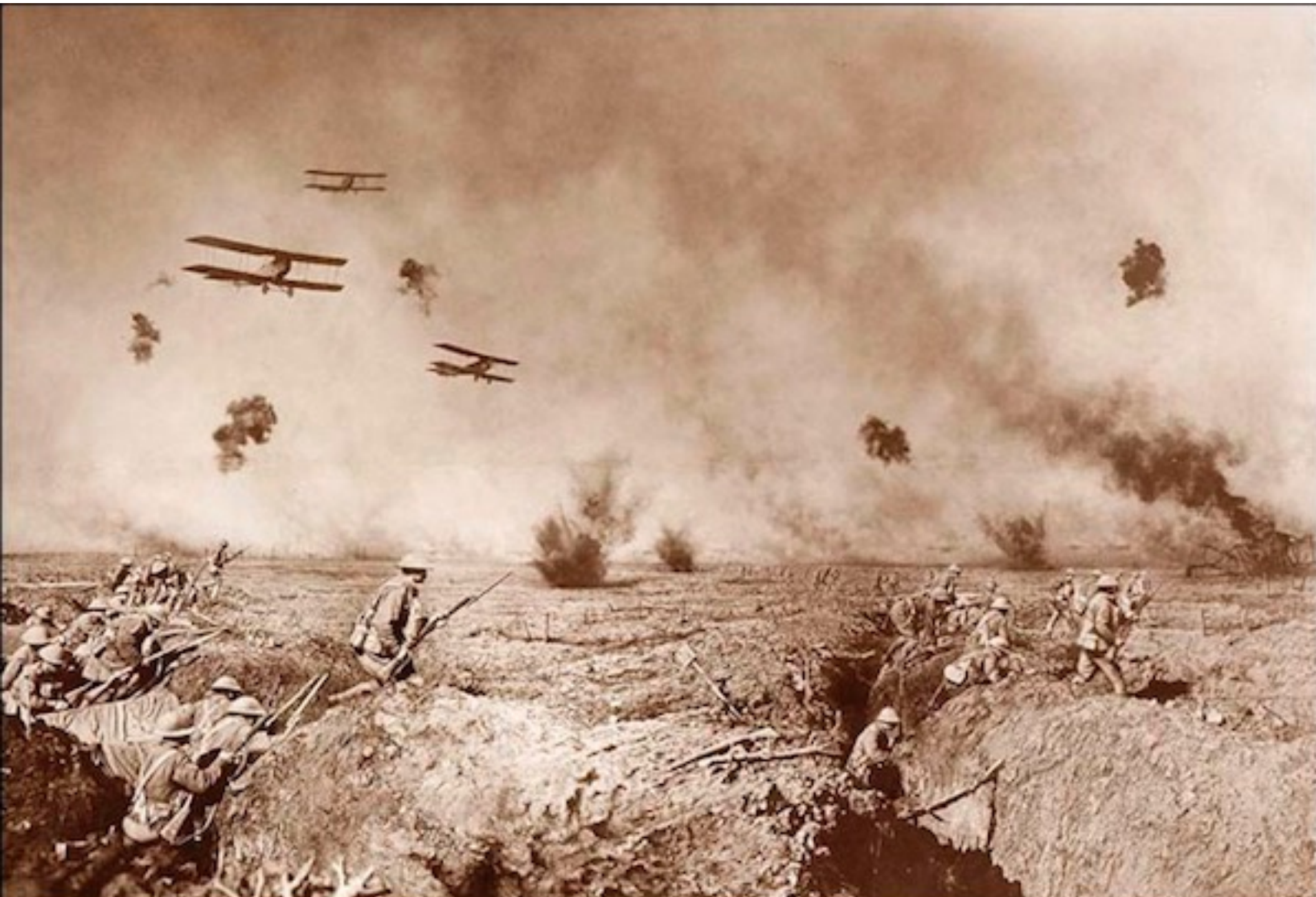
Frank Hurley, The Raid, 1917