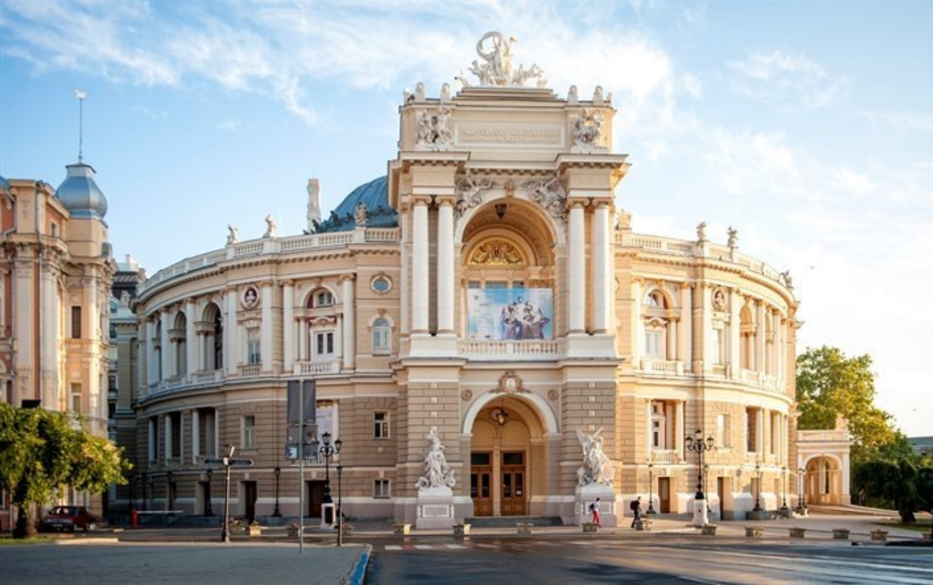
Theater in Odessa (1809)